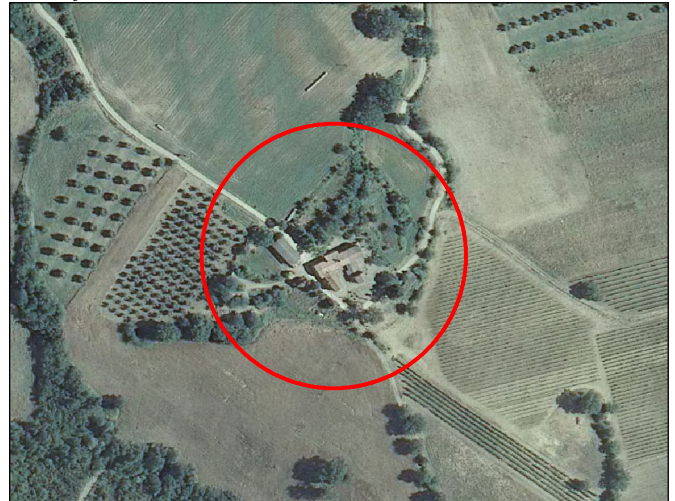
foglio n. 308130