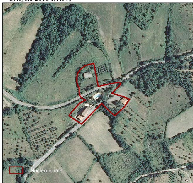
foglio n. 307120