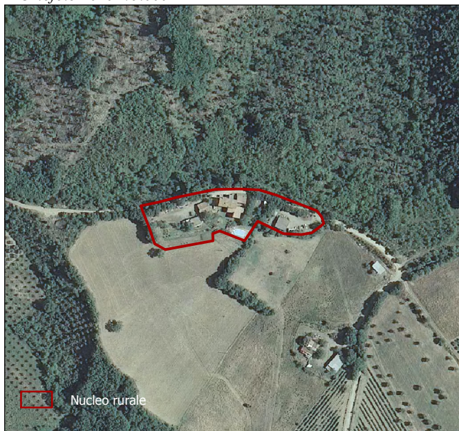
foglio n. 307120, foglio n. 308090